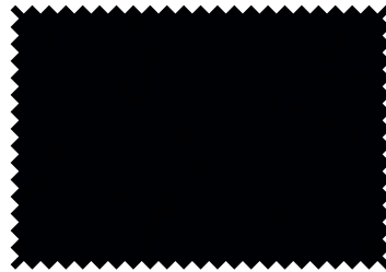
154 Black Widow