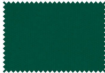
162 Olive Green