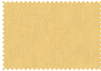
158 Butter Cup