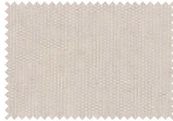
160 White Sand