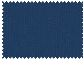
156 Night Blue