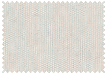
167 Natural White

Dickson® gilt als Referenz für wirkungsvollen Sonnenschutz. Das Gewebe schirmt dauerhaft und zuverlässig vor Wind und Wetter, Helligkeit, Hitze und UV-Strahlen ab. Das 100% spindüsengefärbte Polyacryl ist dank der Outdoor-Spezial-Imprägnierung Cleanguard dauerhaft farbbeständig, wasser- und schmutzabweisend sowie reißfest. Der UV-Schutz UPF 50+ ist nach australischer Norm (AS/NSZ 4399-1996) die höchste Note.